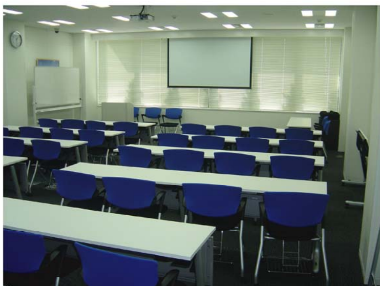
定員52名・スクール形式のレイアウトです。