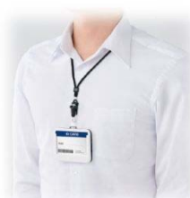
首からかけて携帯