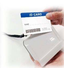
カードホルダー としても