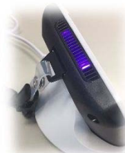
専用スタンドに 置けば卓上でも